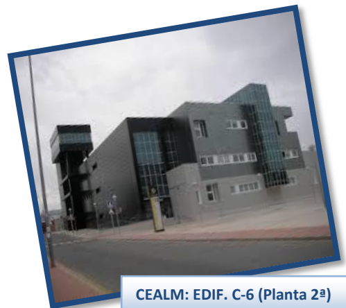
CEALM: EDIF. C-6 (Planta 2ª)